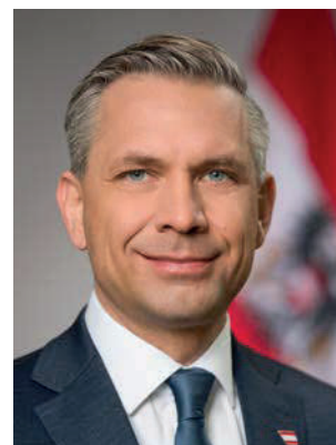
Bundesminister Dr. Wolfgang Hattmannsdorfer